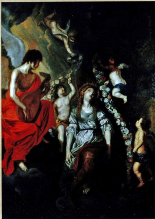
Eglise St. Jean, Luxembourg Grund "Sainte Rose de Lima" après restauration Janvier 2005