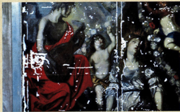
Le stucs après le nettoyage et le rentoilage